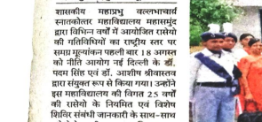
राष्ट्रीय स्तर पर महाविद्यालयीन रासेयो गतिविधियों का मूल्यांकन