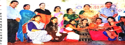
स्वच्छता पखवाड़ा में ब्लॉक के सभी महाविद्यालय और स्कूल के स्वयं सेवक हुए शामिल

महासमुंद, बसना, सरायपाली के समीप स्थित नगर के सभी स्कूल एवं महाविद्यालय के शोध सेवा योजना इकाईयों ने जागरूकता के कार्यक्रमों में जागीर पर जागरूकता रैली निकाली।