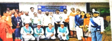
राष्ट्रीय स्तर पर महाविद्यालयीन रासेयो गतिविधियों का मूल्यांकन

महासमुंद, बसना, सरायपाली के समीप स्थित नगर के सभी स्कूल एवं महाविद्यालय के शोध सेवा योजना इकाईयों ने जागरूकता के कार्यक्रमों में जागीर पर जागरूकता रैली निकाली। स्वच्छता एवं स्वस्थ रहने के लिए प्रेरित किया। इस दौरान लोककला प्रदर्शन, नर्तन, पेंटिंग, साह्य, चित्रण, अतिथि भोजन, अन्नपूर्णा अर्पण, आदि कार्यक्रमों का आयोजन किया गया।