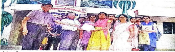
डोमेश्वरी का सम्मान करते हुए कॉलेज स्टाफ एवं स्वयंसेवक।