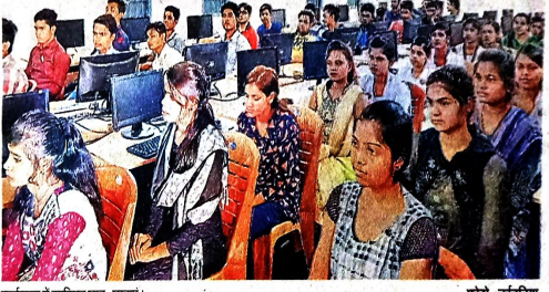
कार्यशाला में उपस्थित छात्र-छात्राएं।