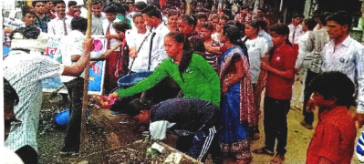
जागरूकता रैली निकाली जा रही है।

समाजिक सचेतना बढ़ाने और स्वच्छता पखवाड़ा के माध्यम से जागरूकता रैली निकाली। स्वच्छता एवं स्वस्थ रहने के लिए प्रेरित किया। इस दौरान लोककला प्रदर्शन, नर्तन, पेंटिंग, साह्य, चित्रण, अतिथि भोजन, अन्नपूर्णा अर्पण, आदि कार्यक्रमों का आयोजन किया गया।