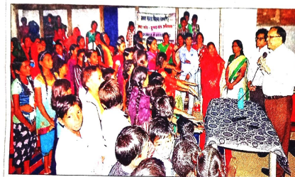
कार्यक्रम में उपस्थित महिलाएं, बच्चे एवं कलेक्टर।

महासमुंद (बुरी)। जिले में विधवा और पतिव्रता महिलाओं को शासकीय योजनाओं का लाभ दिलाने के लिए 30 अक्टूबर को जिला स्तर पर जनकल्याण मेले का आयोजन किया गया। जिले में 6 माह के दौरान पंचायतों में लगाने गए जनकल्याण मेले, स्वास्थ्य शिविरों, लोक सुख अभियान, जनसम्पर्क निवारण शिविरों, सम्मान 36 करोड़ों तथा विधवा शिविरों के माध्यम से 30 हजार विधवा और पतिव्रता महिलाओं को स्वास्थ्य