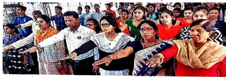
महासमुंद, मानवाधिकार की शपथ लेते हुए कॉलेज के शिक्षक और छात्र।